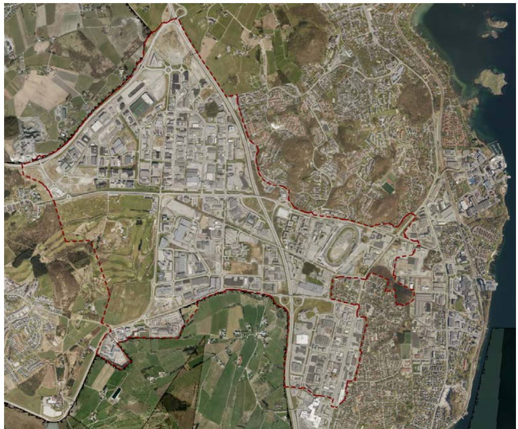
Flyfoto med plangrensen

Kommunene Sandnes, Sola og Stavanger vedtok i mai å sende Interkommunal kommunedelplan for Forus på høring. Se vedlagt flyfoto og plankart der planområdet er markert.