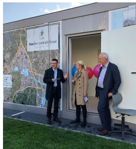
Nyetablert åpent kontor. Ordførerne deltok ved åpningen og hadde møte med media.

Ordførerne møtte mediene på Forus 31. august, og åpnet samtidig «åpent kontor-container» som vi fikk tillatelse til å plassere på parkeringsplassen til Tvedtsenteret. Der deltok de fleste mediene, og planen fikk god dekning i de fleste medier. Stavanger Aftenblad, TV vest, Rosenkilden og Solabladet