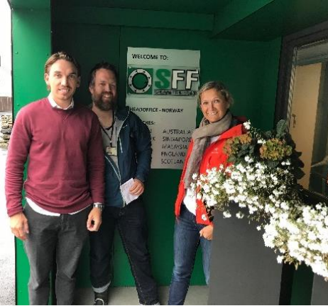
Fra to av bedriftsbesøkene under åpent kontor dagene.