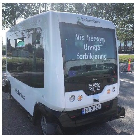
Vi intervjuet bussjåføren i den førerløse bussen.