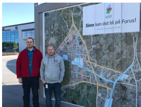
To av besøkene ved kontor-containeren.

I forkant hadde vi laget et intervjuopplegg. Til sammen ble det 25 intervju, og i mange tilfeller var en hel gruppe med i samme intervju. Intervjusteder: I starten snakket vi mest med folk som passerte containeren, og vi snakket med folk på parkeringsplassene ved Tvedtsenteret og ved bussholdeplassene i Lagerveien. Vi tok også den førerløse bussen og intervjuet sjåføren der. Etter hvert gikk vi på bedriftsbesøk. Vi banket på dører og fikk komme inn til flere. Vi tok også initiativ til møte med Equinor for å informere om planen og med ønske om å motta uttalelse.