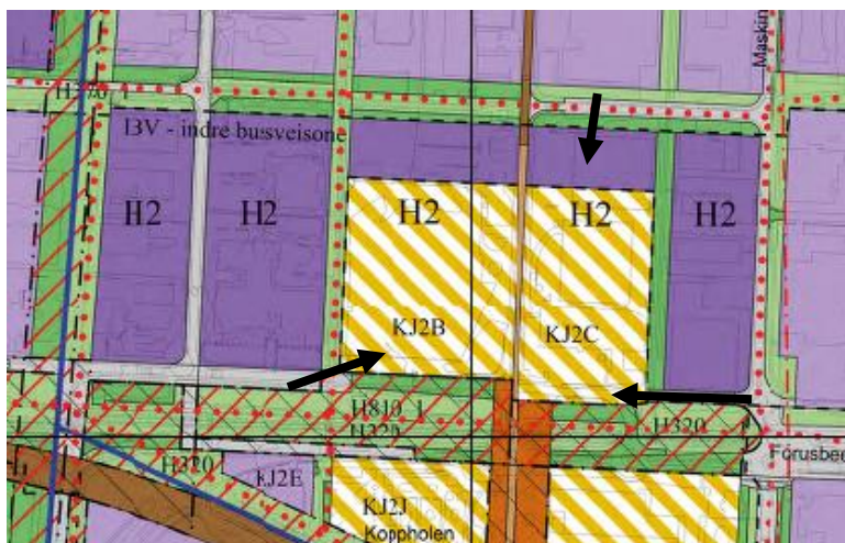
Figur 2 Adkomster til Tvedtsenteret.

Vi har sjekket nærmere hvilke avvik som finnes mellom siste versjon av IKDP Forus, og høringsutkastet til detaljplan for Tvedtkvartalet. Kartutsnittet under viser detaljplanutkastet og dets arealformål. Over arealformålene er vist med røde stiplede linjesymbol formålsgrensene i siste versjon av plankartet til IKDP Forus. De største avvikene er: Tvedtplanen viser kombinert formål på alle byggeområdene, IKDP viser kombinert formål i de to feltene innenfor kjerneområdet, ellers er vist næringsformål. IKDP Forus tillater ikke rene kontorformål utenfor kjerneområdet. Der er satt av jevnt over 6-7 meter bredere grønnstruktur i IKDP enn i Tvedtplanen. I tillegg er satt av en ekstra bredde til grønnstruktur foran et av Tvedt-feltene for å få variasjon i bygningsmassen og ekstra rom på en avgrenset strekning til utposning i vannmiljø, uteservering m.m. I siste versjon av IKDP er vist adkomster fra øst og vest til de to feltene på hver side av Lagerveien. I Tvedtplanen er det i tillegg vist tre andre adkomster fra Forusbeeen. IKDP Forus viser som prinsipp flere steder langsgående grøntstruktur mellom vei og byggeformål, det vil være mulig å krysse. For Tvedt betyr det at det er mulig å etablere adkomster fra nord til de to feltene øst for Lagerveien. Tvedtplanen viser også en adkomst som krysser bussveien (Lagerveien) i bakkant, nord for Tvedtsenteret. Tvedtplanen viser Forusbeeen åpen for gjennomkjøring, mens IKDP legger til rette for at Forusbeeen stenges.